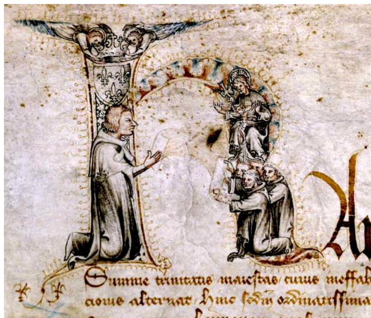
Charte de fondation des Célestins de Limay, 1376, 41H48, détail

La lettre historiée , plus tardive, est l'aspect le plus original de la mise en page de l'illustration au Moyen Âge. L'image est intégrée dans l'écriture même du texte : c'est une véritable mise en scène à l'intérieur d'une lettre, qui sert elle-même de décor à une autre mise en scène du texte qui est la page. Elle sert de résumé illustré du début ou de l'ensemble de l'histoire et peut délivrer un message.