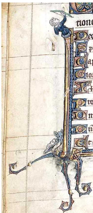
Livre d'heures du Couvent des Récollets den Versailles [XIIIe siècle], 57H1, détail

Tout a une signification : la position des mains, des têtes, des pieds des personnages et des animaux, leur taille, les couleurs.