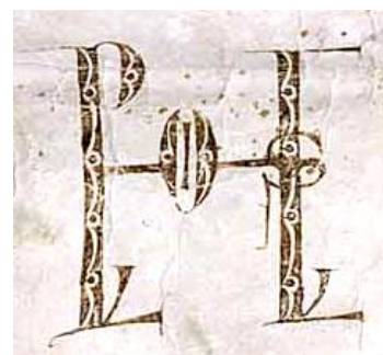
Charte de Saint Louis concernant l'Abbaye de Joyenval, 1237, 48H2, détail du monogramme

Signe composé de la réunion de plusieurs lettres d'un même nom.